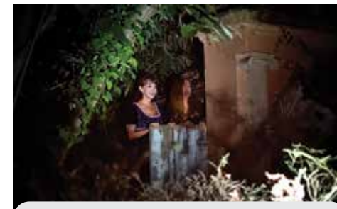
2018: Frankenstein a Villa Salina

Da molti considerato il migliore racconto di fantascienza mai scritto, è ambientato su un pianeta immaginario, Kalgash, simile alla terra e situato in una galassia sconosciuta. Il pianeta è abitato da creature identiche agli esseri umani ma è avvolto da una luce solare perpetua e gli abitanti di Saro City, nel cui Osservatorio astronomico si svolge il racconto, non hanno mai visto le stelle, e