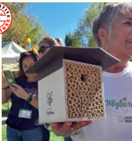
Una delle casette per le api consegnate a Castel Maggiore nell'ambito della campagna promossa da Coop Alleanza e sostenuta dal gruppo Castel Maggiore, alla Festa del Volontariato