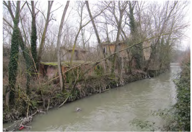
Due immagini del Navile presso il Sostegno della Chiusetta, al confine tra i comuni di Bologna e Castel maggiore