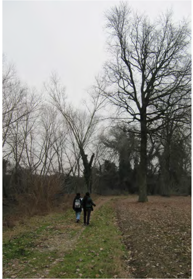
Il sentiero a margine dei coltivi nel territorio di Castel Maggiore