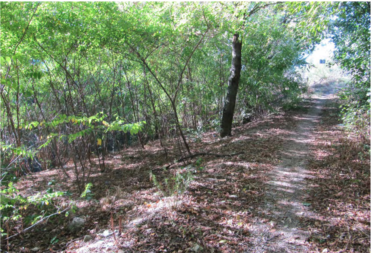
Il sentiero a valle del ponte