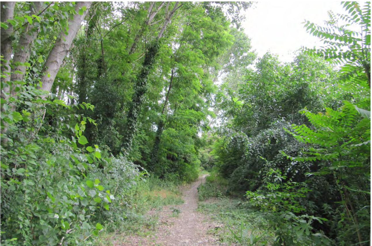
La folta vegetazione che accompagna il sentiero poco a monte di Castello