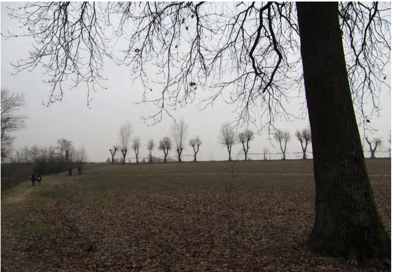
Uno scorcio del paesaggio rurale relitto lungo il Navile a Castel Maggiore