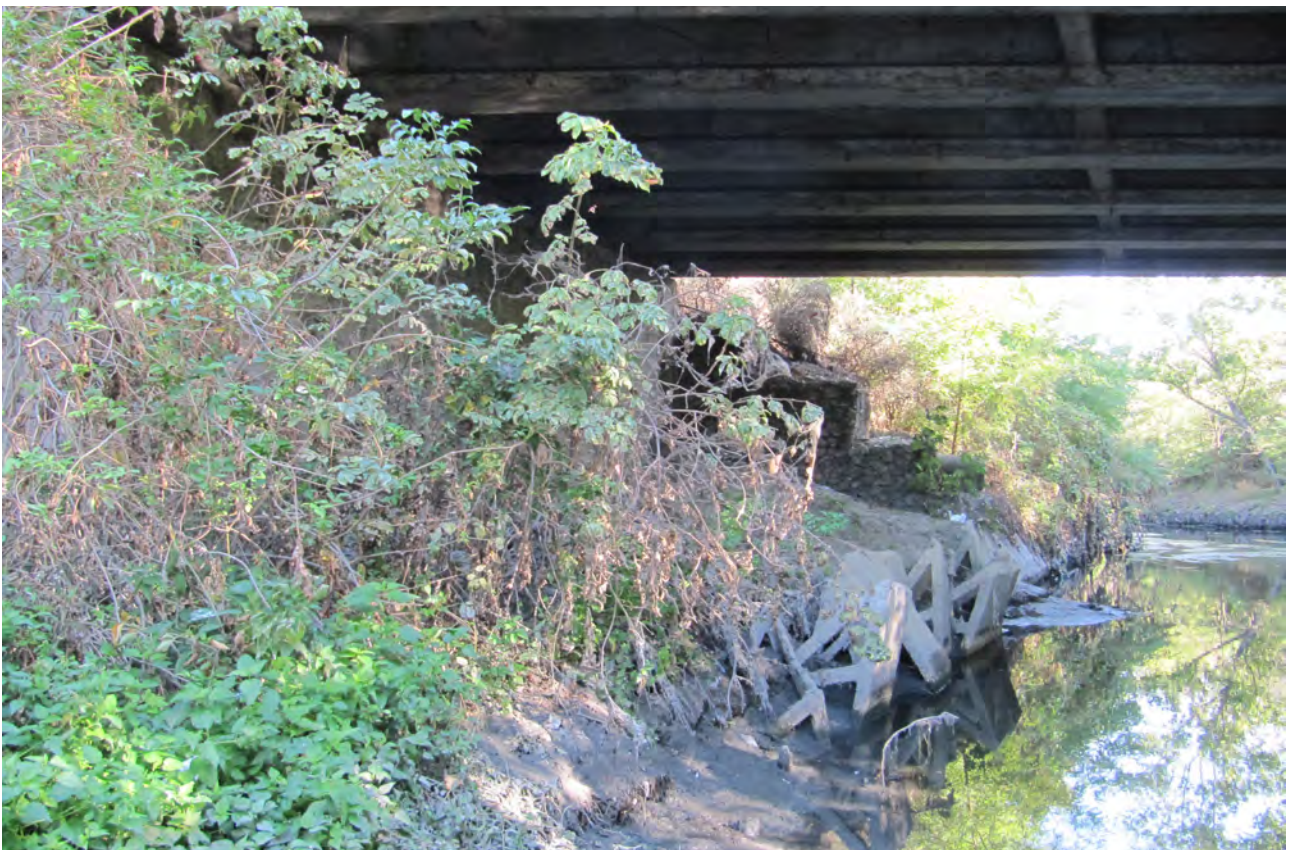
Alcuni dettagli dell'area a monte del ponte