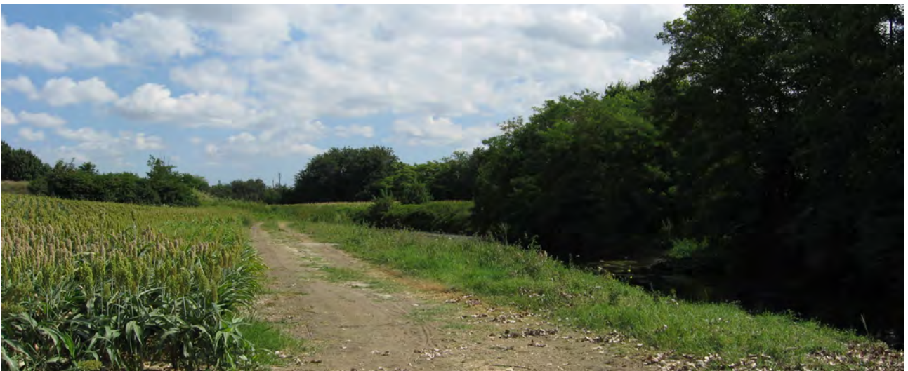
La futura prosecuzione del Lungo Navile a valle di Castello