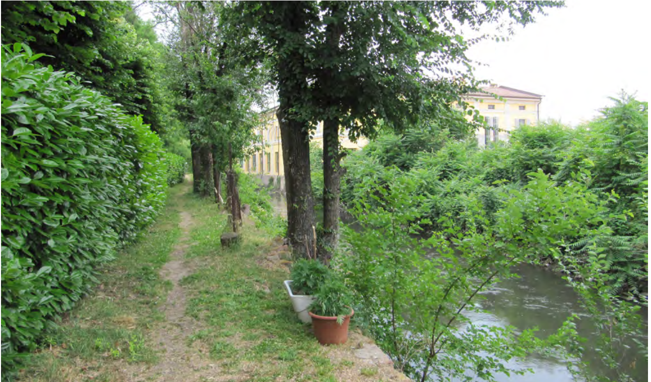
Il sentiero in vista del nucleo di Castello