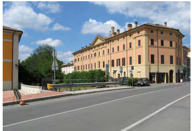
Via Matteotti a Castello, punto conclusivo degli interventi di progettodi navigazione