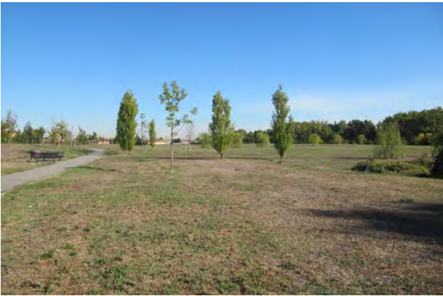
Una veduta della nuova area verde pubblica lungo via Angelelli