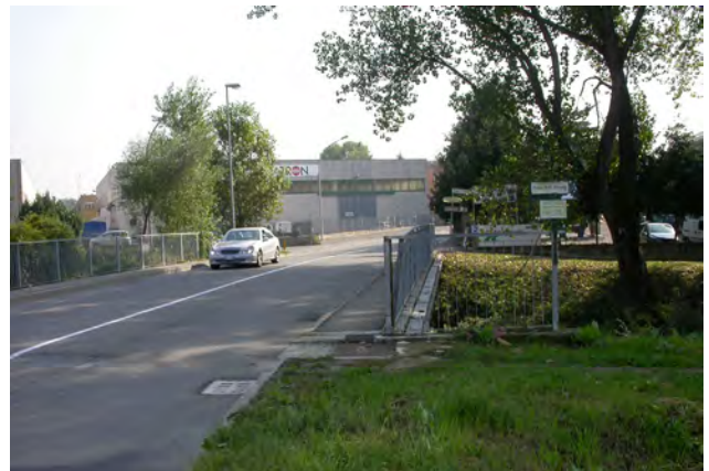
Due esempi di intersezioni stradali del Lungo Navile : via di Vittorio, a sinistra, evia dei Terraioli, a destra