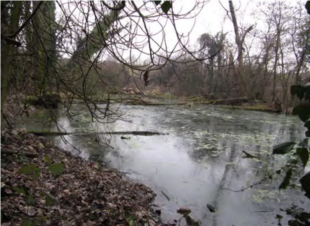
Lo specchio d'acqua a lato del sentiero poco a valle di via di Vittorio