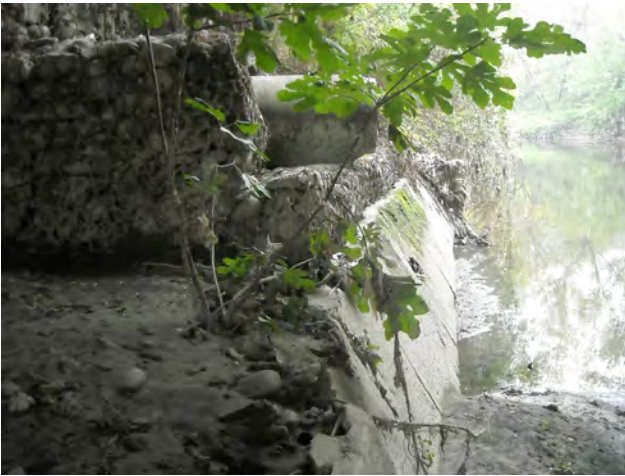
Alcuni dettagli del sottoponte