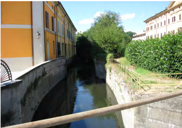
L'antico Sostegno di Castagnolo, a Castello, con la conca di navigazione