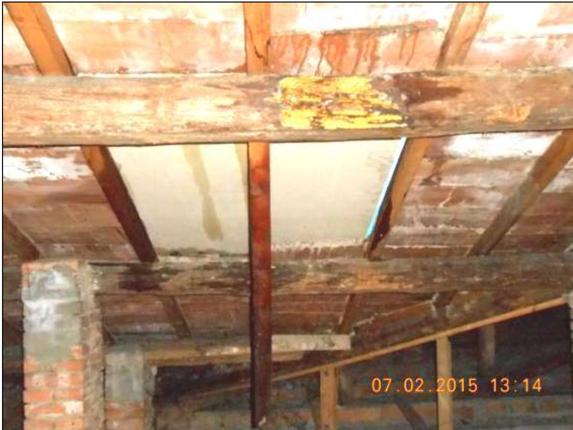
FOTO 06_foto sottotetto - stato della copertura. La presente foto è stata scattata il 7/2/2015, prima degli interventi di messa in sicurezza; si nota la porzione di solaio interessata dal cedimento (causa deposito neve). Si nota un'ingente quantità di infiltrazioni d'acqua.