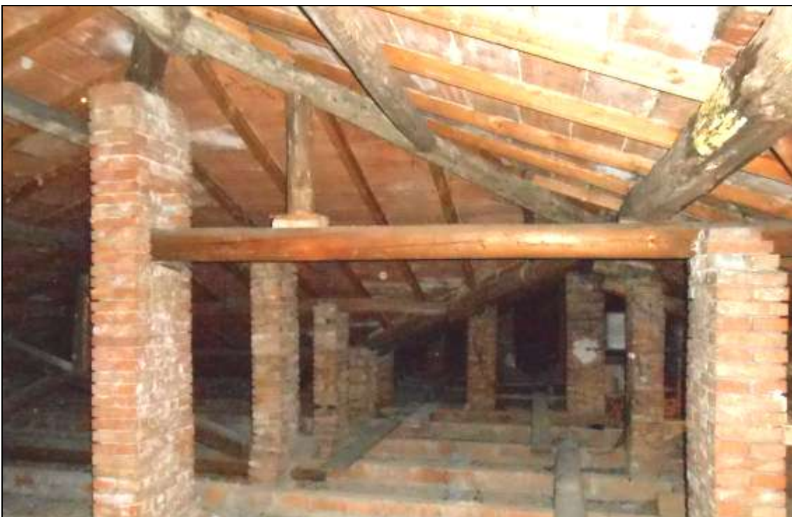
FOTO 05_foto sottotetto - stato della copertura: si notano molte tavole color bianco (infiltrazioni d'acqua, deposito dei sali); in alto a destra si nota la trave parzialmente marcia (da sostituire). La presente foto è stata scattata il 7/2/2015 prima degli interventi di messa in sicurezza (puntellatura delle travi risultate parzialmente marce).