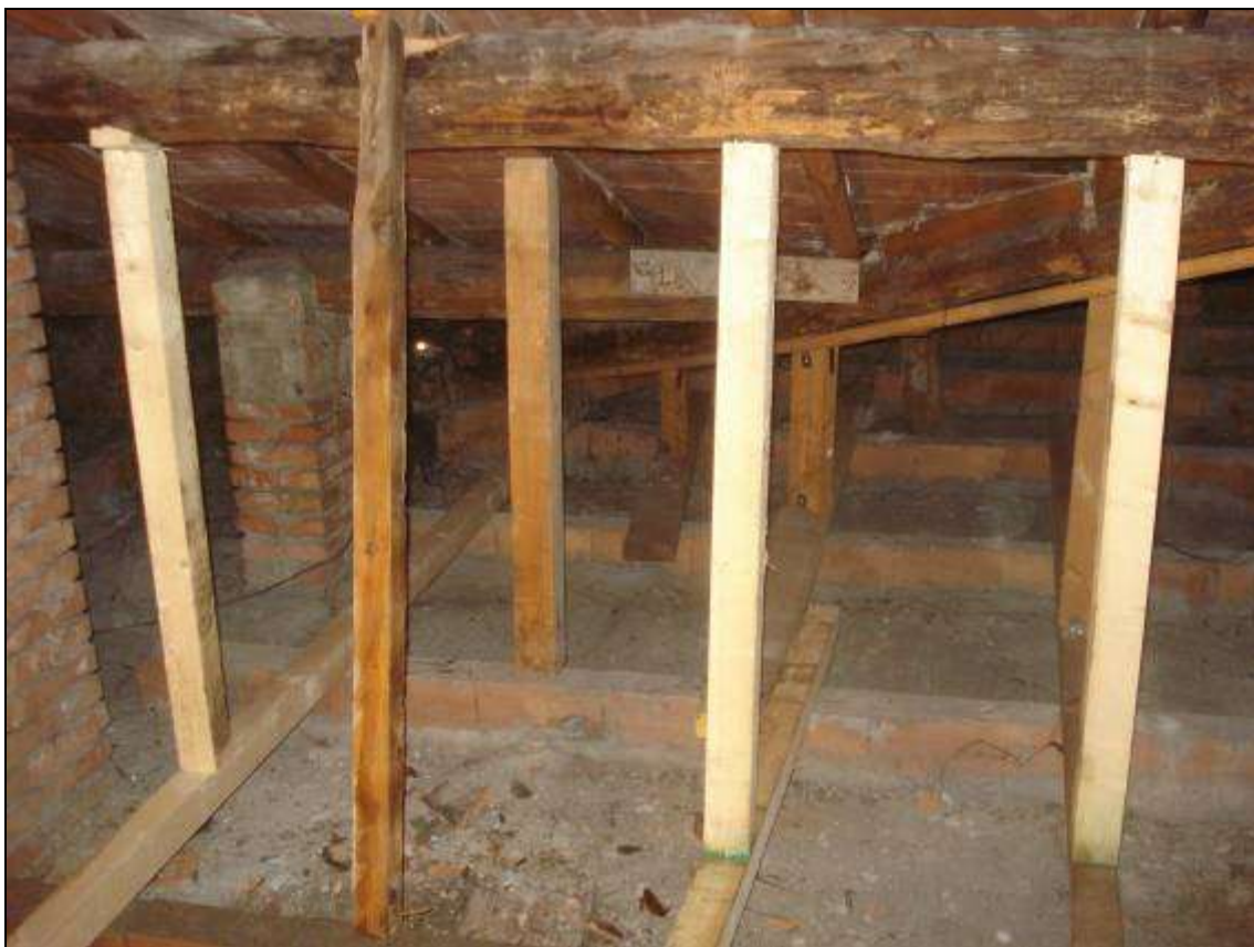
FOTO 07_foto sottotetto - stato della copertura. La presente foto è stata scattata il 9/2/2015 dopo gli interventi di messa in sicurezza; si nota la puntellatura temporanea di alcune travi.