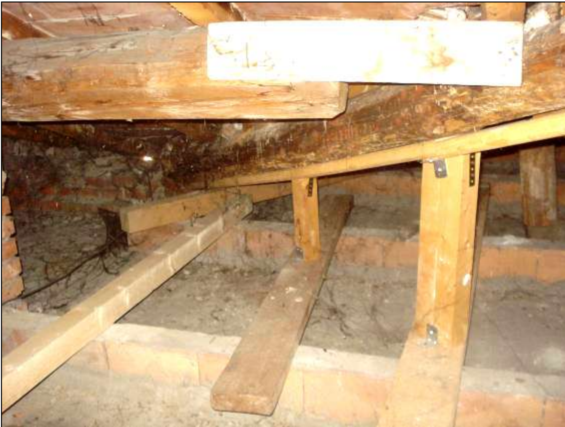
FOTO 08_foto sottotetto - stato della copertura. La presente foto è stata scattata il 9/2/2015 dopo gli interventi di messa in sicurezza: si nota la puntellatura temporanea del cantonale.