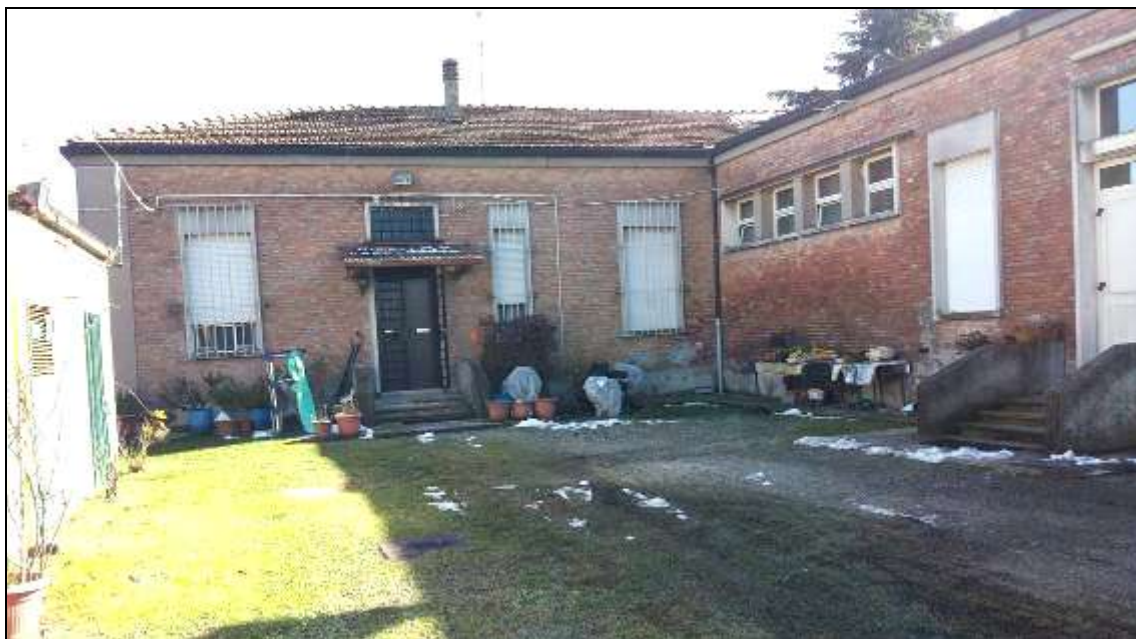
FOTO 02_foto cortile interno (lato Ovest), si nota l'accesso della residenza del custode.