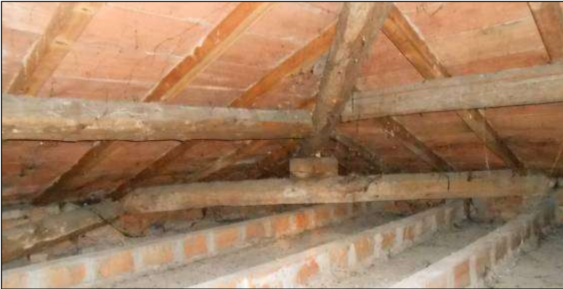
FOTO 04_foto sottotetto,parciolare del cantonale.