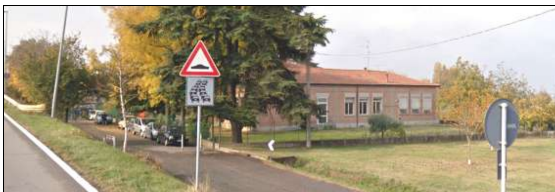
FOTO 03_foto lato Est, scatto da via Matteotti.