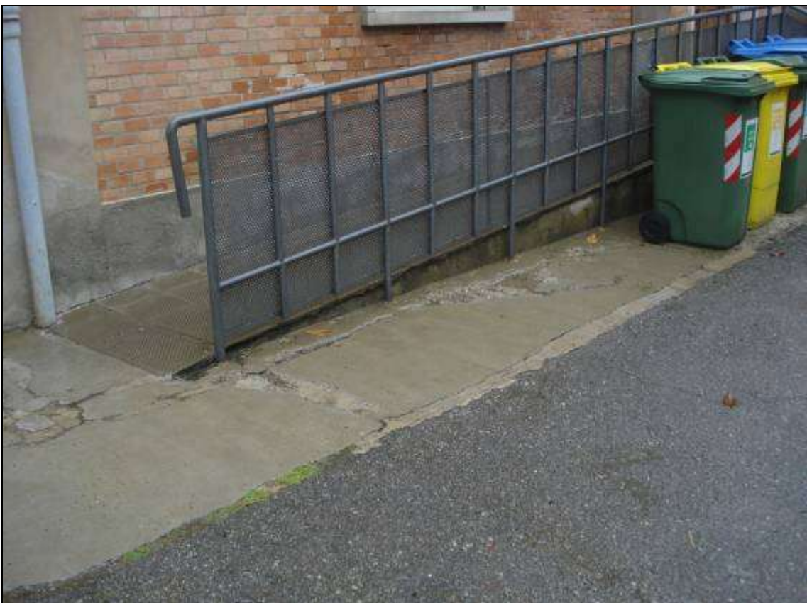
FOTO 11_Esterno, ingresso principale: marciapiede lesionato in più punti.