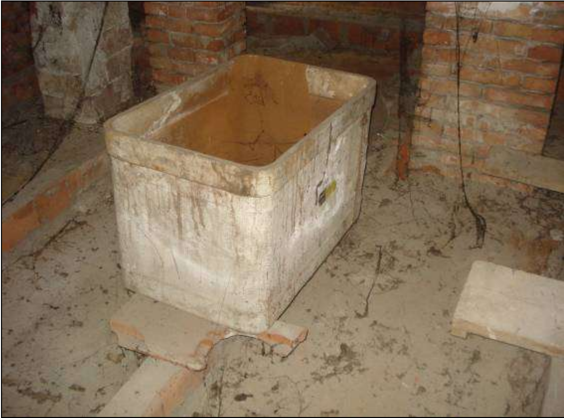
FOTO 10_foto sottotetto: vasca in eternit (dismessa). Da rimuovere a carico di ditta abilitata.