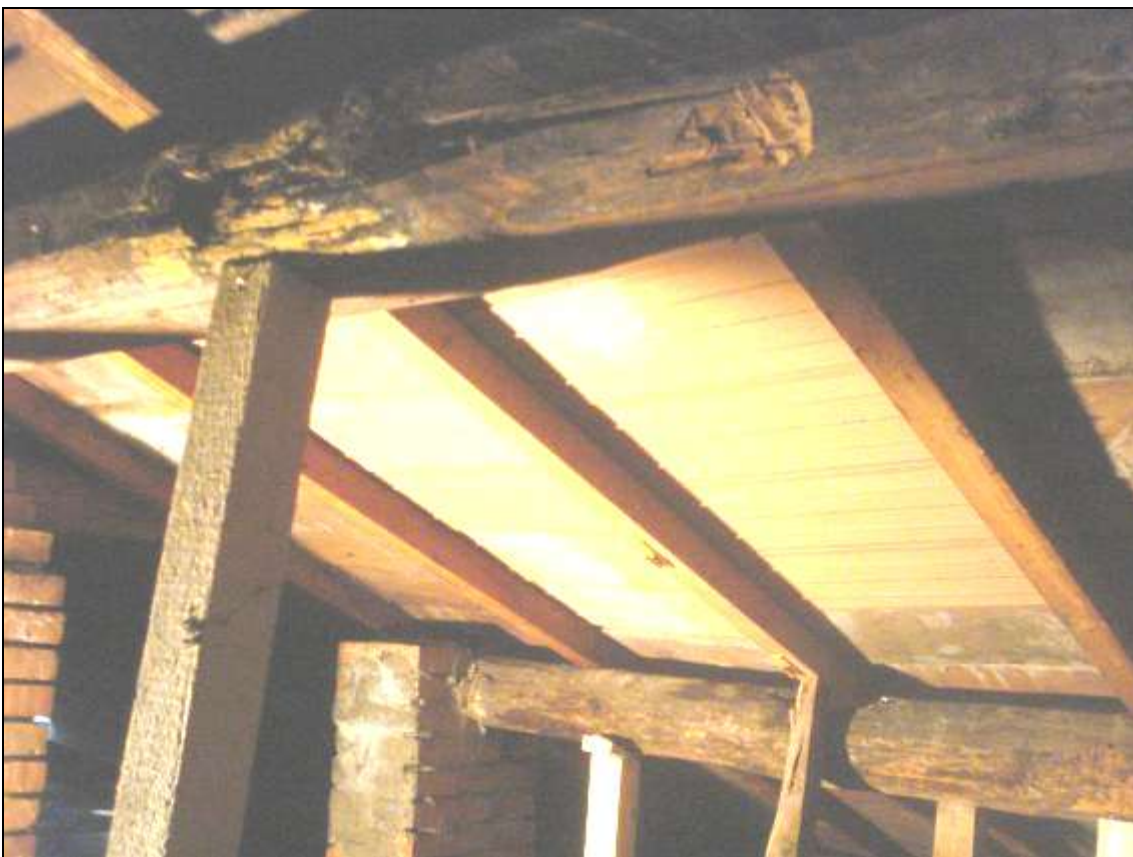
FOTO 09_foto sottotetto - stato della copertura. La presente foto è stata scattata il 9/2/2015 dopo gli interventi di messa in sicurezza. Il solaio di cui alla foto 06 è stato ripristinato (sono stati sostituiti anche i travetti in questo caso).