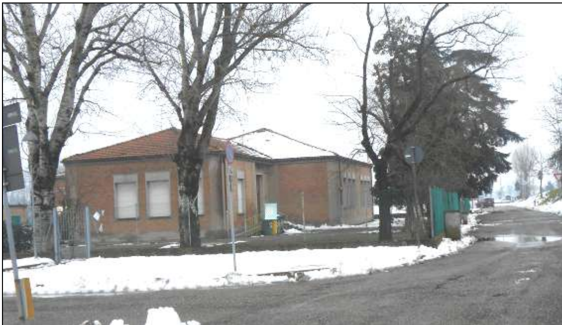
FOTO 01_foto lato Ovest, scatto da parcheggio pubblico.