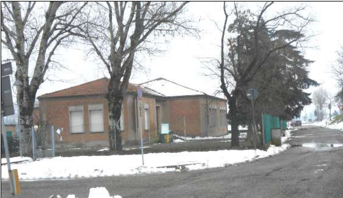
FOTO 01_foto lato Ovest, scatto da parcheggio pubblico.