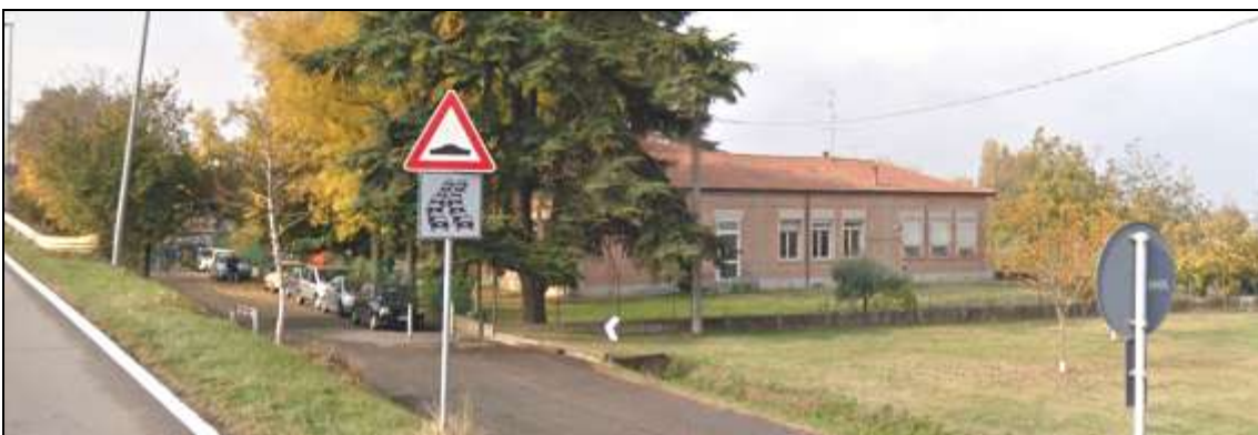
FOTO 03_foto lato Est, scatto da via Matteotti.