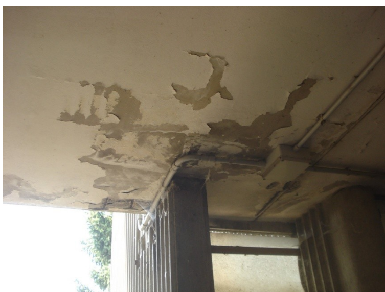
FOTO_21 _armatura esposta, trattare il ferro con prodotto anticorrosione, ricostruire il copriferro, ripristinare intonaco in fase di distacco