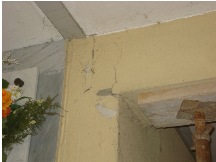
FOTO_08 lesione all'appoggio delle trave