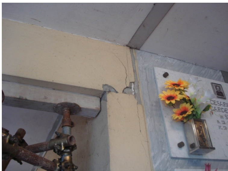
FOTO_07 _lesione all'appoggio delle trave