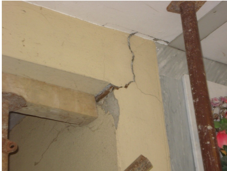
FOTO_10 _lesione all'appoggio delle trave