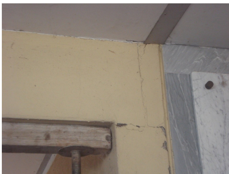
FOTO_03_lesione all'appoggio delle trave