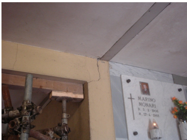
FOTO_18 lesione all'appoggio delle trave