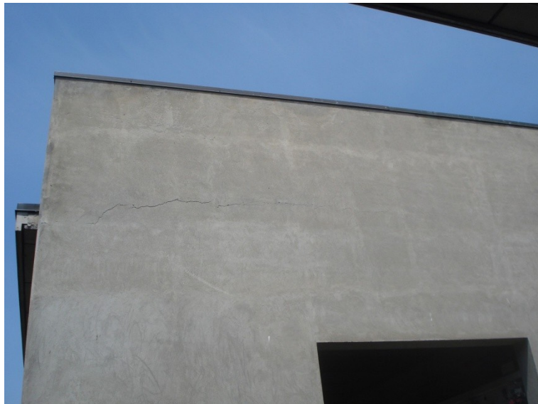
FOTO_29 lesione nel "timpano"