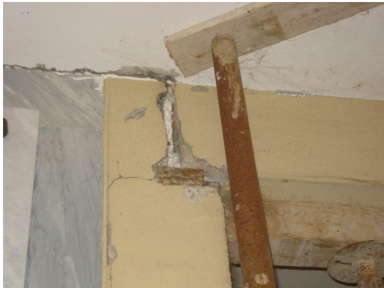
FOTO_11 _lesione all'appoggio delle trave