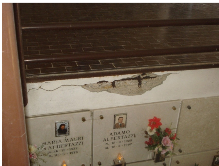
FOTO_20 _armatura esposta, trattare il ferro con prodotto anticorrosione e ricostruire il copriferro