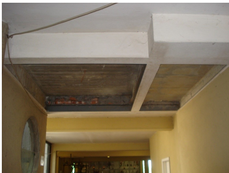
FOTO_23_ contrsoffitto rimosso, intonacare il restante (rete-rasatura) e ritinteggiare i profilati metallici di color bianco