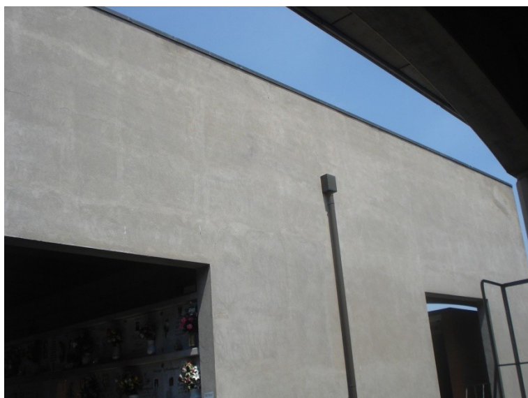
FOTO_30 lesione nel "timpano"