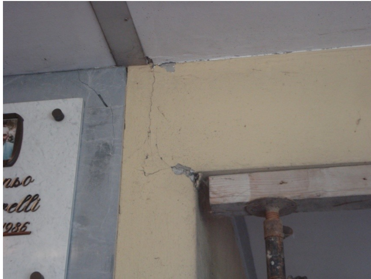
FOTO_13_lesione all'appoggio delle trave