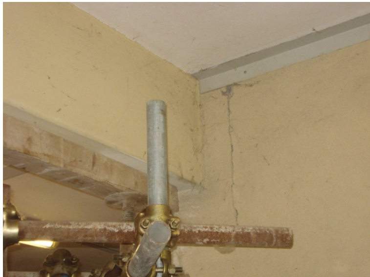
FOTO_14_lesione all'appoggio delle trave