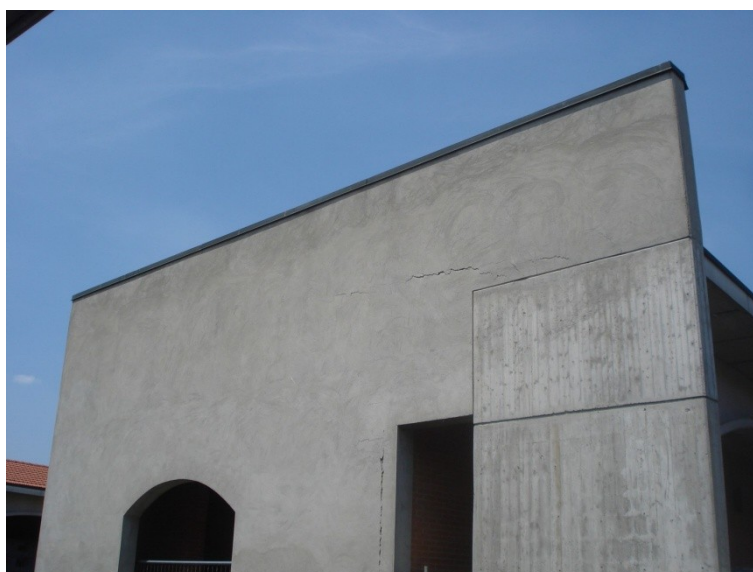
FOTO_27_lesione nel "timpano"