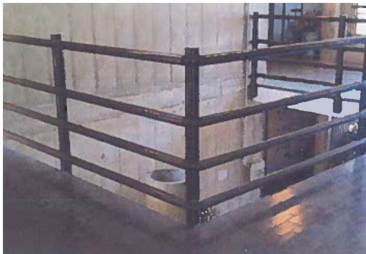
FOTO_31_ "Blocco Canale", parapetti da adeguare (taglio correnti centrali ed inserimenti candele verticali).