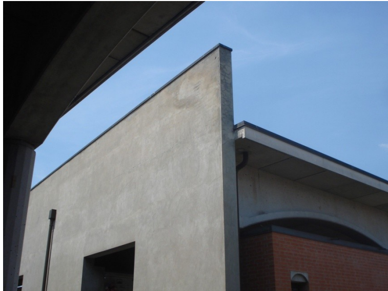
FOTO_28 lesione nel "timpano"