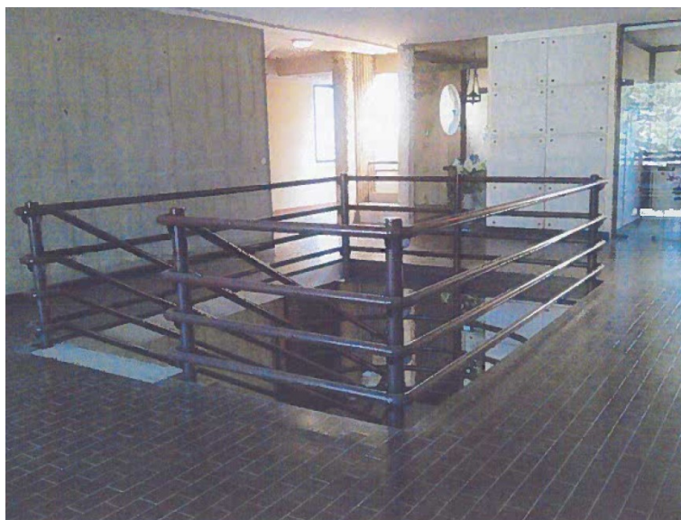
FOTO_33_ "Blocco Canale", parapetti da adeguare (taglio correnti centrali ed inserimenti candele verticali)