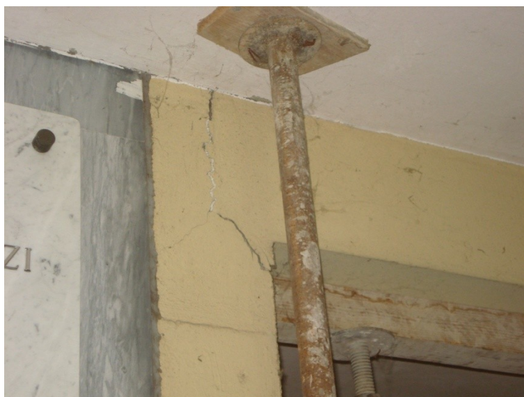
FOTO_02_lesione all'appoggio delle trave