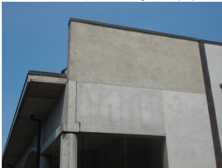
FOTO_25_lesione nel "timpano"