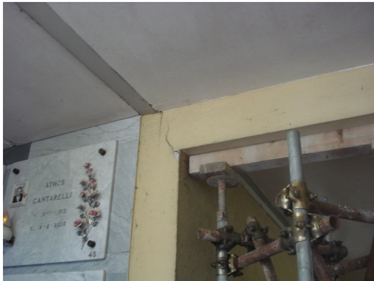
FOTO_17 lesione all'appoggio delle trave