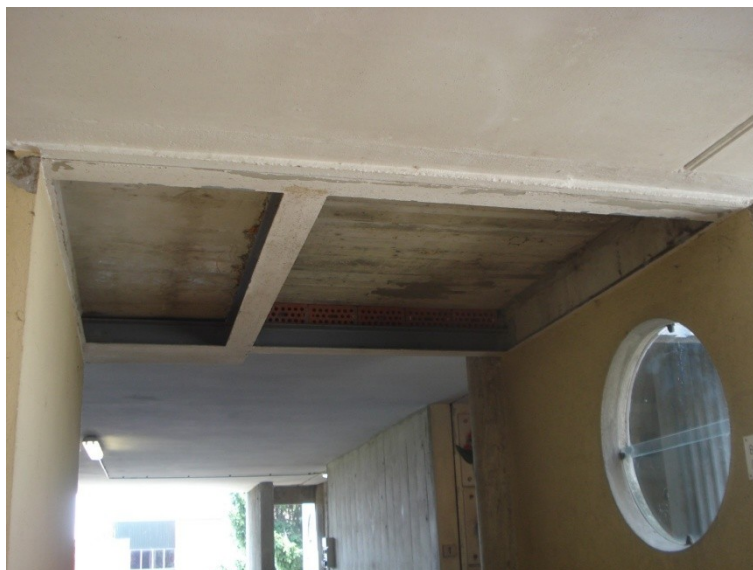
FOTO_19 _contrsoffitto rimosso, intonacare il restante (rete-rasatura) e ritinteggiare i profilati metallici di color bianco