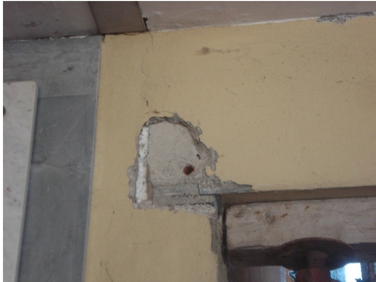
FOTO_04 lesione all'appoggio delle trave