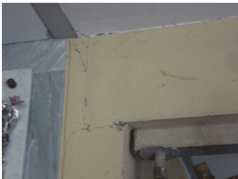
FOTO_06 lesione all'appoggio delle trave