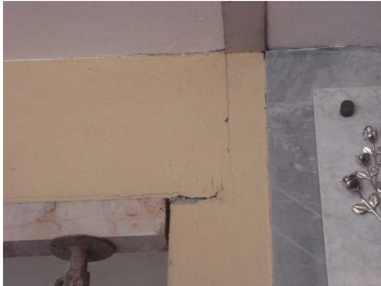
FOTO_16 lesione all'appoggio delle trave