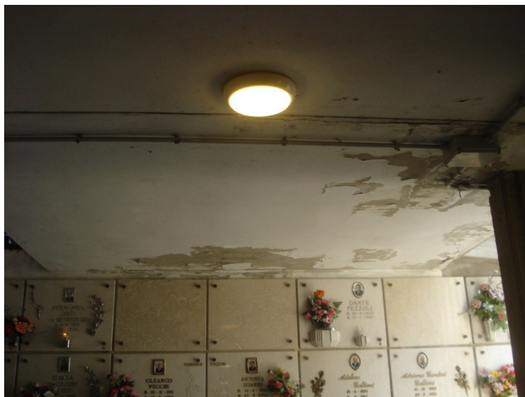
FOTO_22_ ripristinare intonaco in fase di distacco