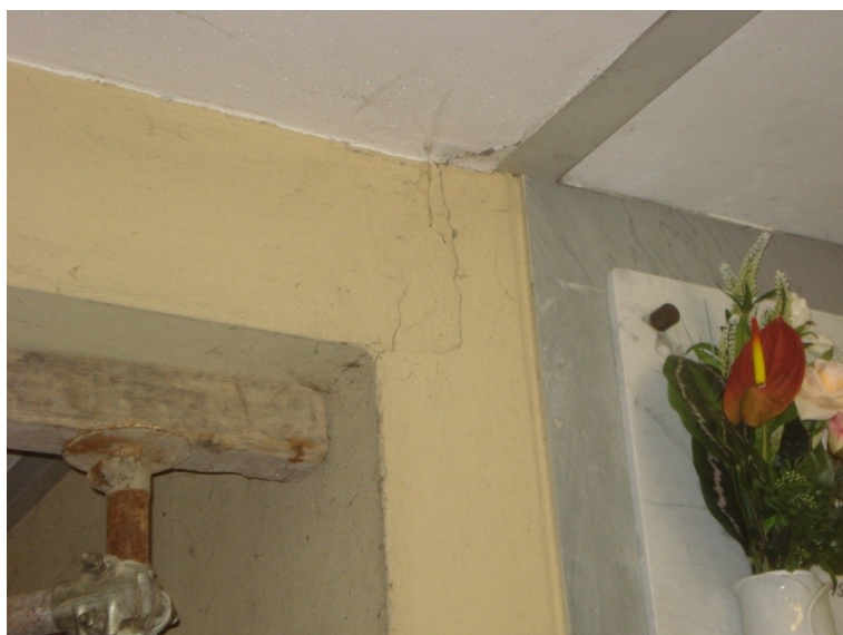
FOTO_09 lesione all'appoggio delle trave