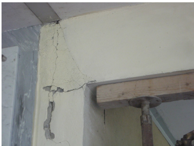
FOTO_15_lesione all'appoggio delle trave