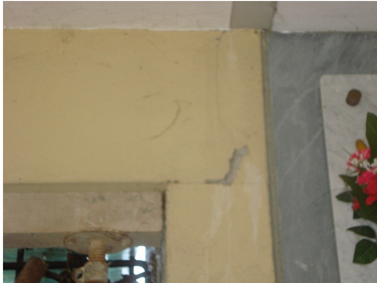
FOTO_07 lesione all'appoggio delle trave