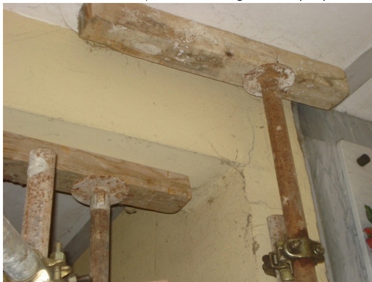
FOTO_01_lesione all'appoggio delle trave