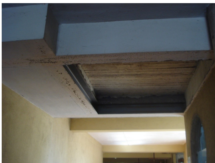
FOTO_24_ contrsoffitto rimosso, intonacare il restante (rete-rasatura) e ritinteggiare i profilati metallici di color bianco