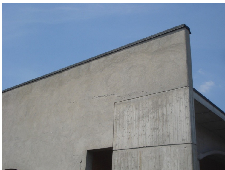
FOTO_26_lesione nel "timpano"