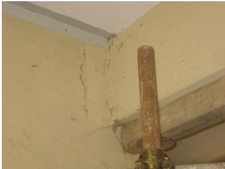
FOTO_05 lesione all'appoggio delle trave