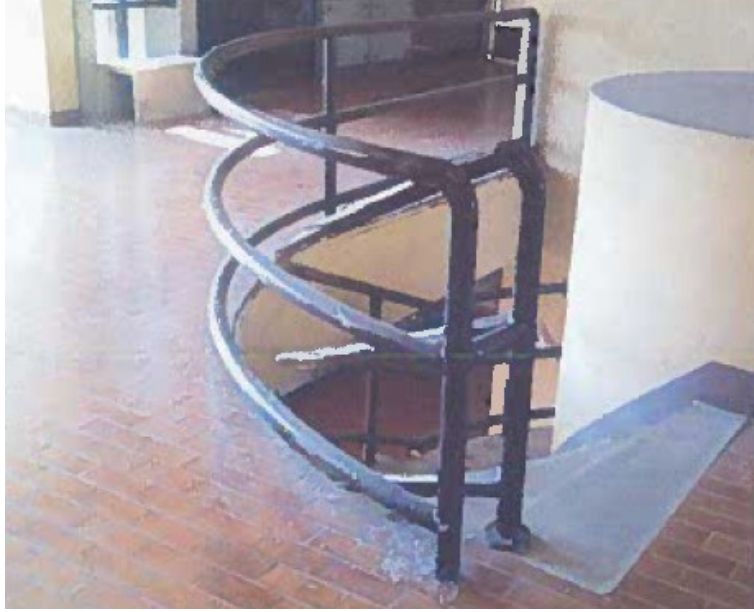
FOTO_34_ "Blocco Canale", parapetti da adeguare (taglio correnti centrali ed inserimenti candele verticali)