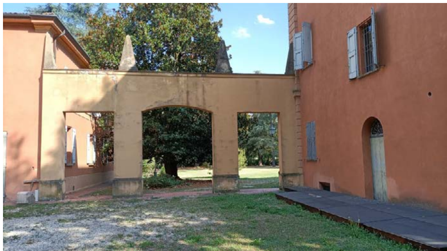
Foto 8: quinta di collegamento tra corpo centrale e settentrionale