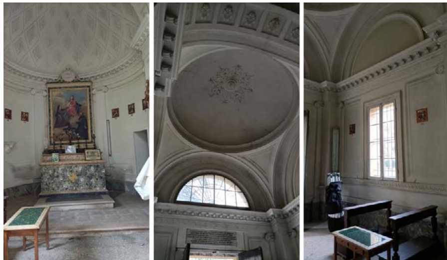
Foto 39-41: (da sinistra) cappella, abside e altare, cupola, fianco sud