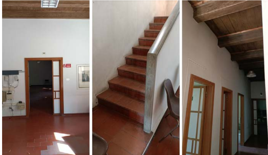
Foto 36-38: (da sinistra) corpo settentrionale, atrio al p. terra, scala, disimpegno al p. primo