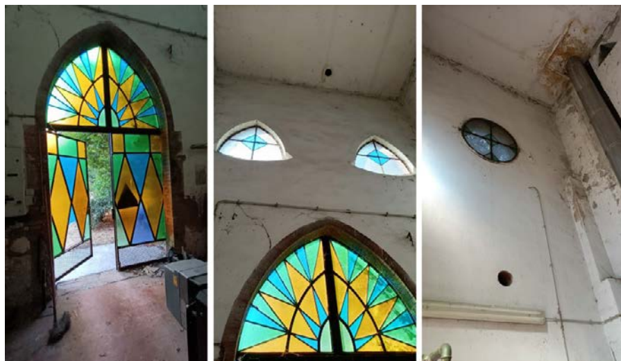
Foto 45-47: (da sinistra) centrale termica, ingresso, particolari soffitto e canna di esalazione