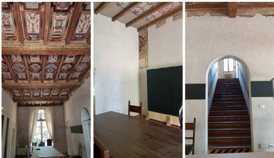
Foto 24-26: (da sinistra) corpo centrale, soffitto della loggia, sala sul lato ovest, scala