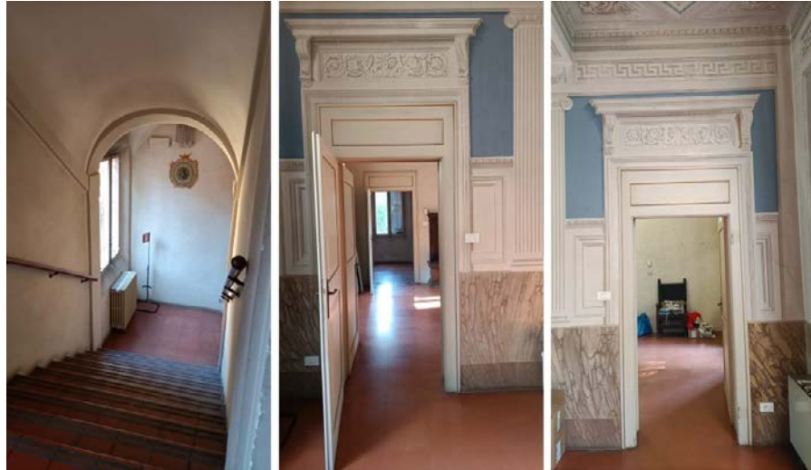
Foto 27-29: (da sinistra) corpo centrale, scala, ambienti del primo piano (dalla loggia)