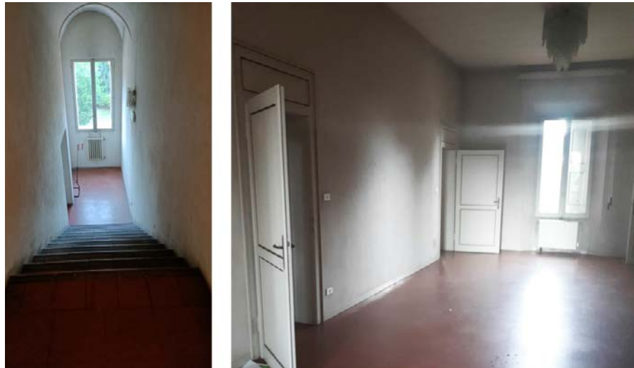
Foto 30-31: (da sinistra) corpo centrale, scala, loggia passante al piano secondo