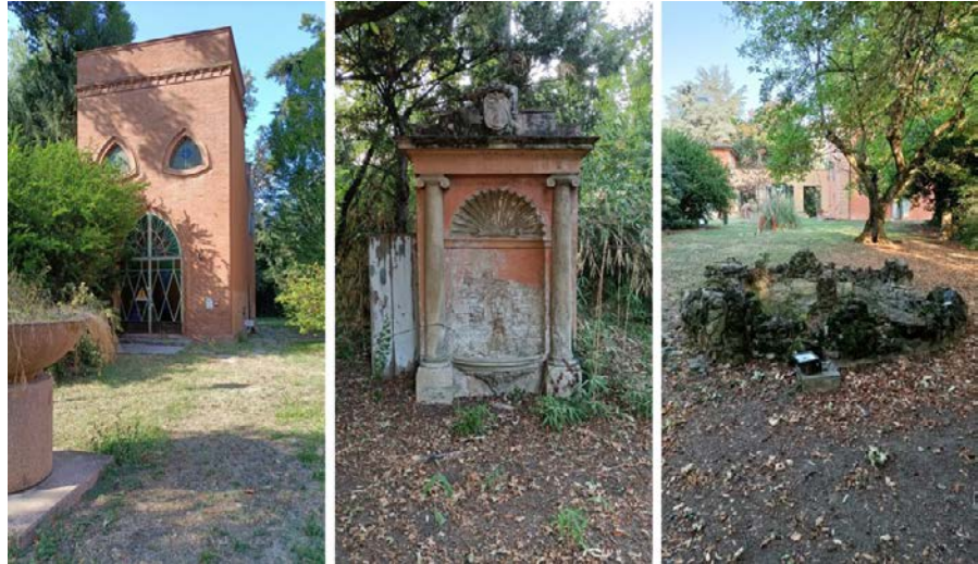
Foto 14-16: (da sinistra) ex serra - centrale termica, fontana, vasca