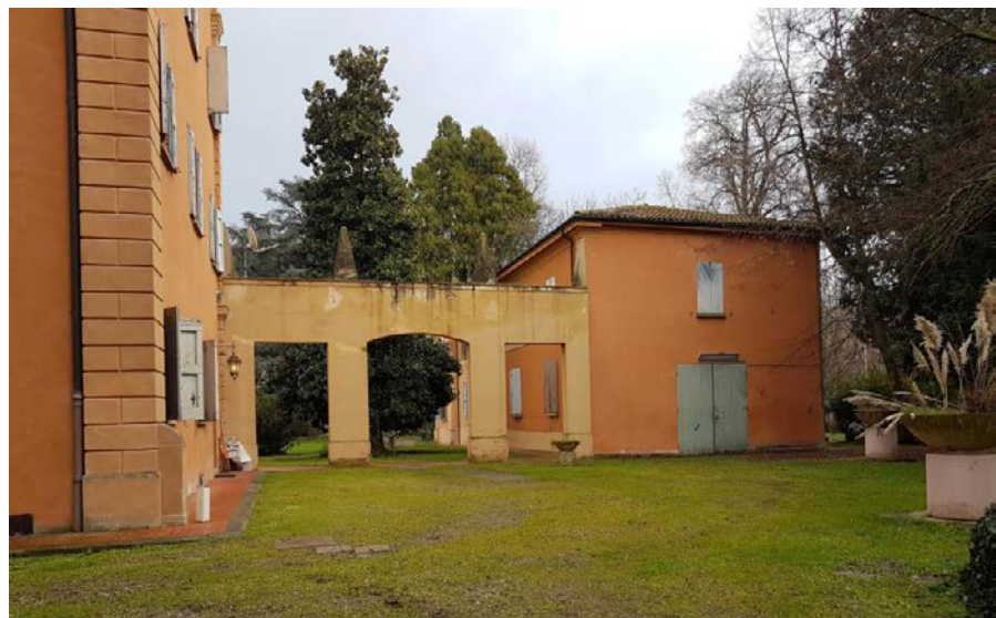
Foto 13: corpo meridionale del complesso e quinta di collegamento, fronte ovest