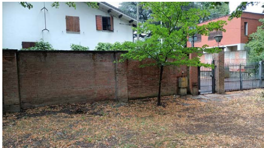
Foto 18: accesso secondario su via I Maggio e muro di confine sul lato ovest