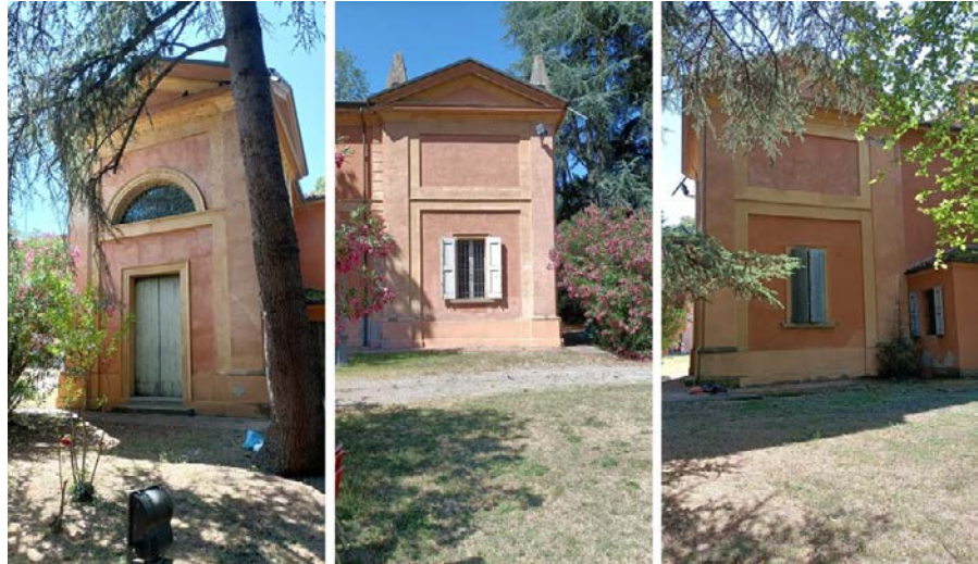
Foto 9-11: (da sinistra) corpo settentrionale, particolare sul fronte est, sud, nord