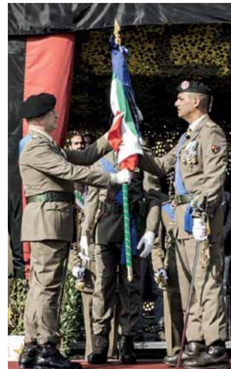
Il tradizionale passaggio della Bandiera di Guerra tra cedente e subentrante ha sancito il trasferimento della responsabilità del comando

Oltre le operazioni di controllo del territorio sono proseguite le attività peculiari della specialità, con il concorso nella gestione del sistema dei trasporti ferroviari nella regione Emilia Romagna nonché gli innumerevoli lavori CAMPALGENIO, tra cui la realizzazione di due complessi modulari ad uso residenziale presso le caserme Annibaldi e Mercanti a Mila-