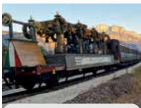
Il Treno della Memoria

Lo scorso anno è ricorso il centesimo anniversario della solenne tumulazione del "Milite Ignoto" presso l'Altare della Patria, al Vittoriano. Per l'occasione è stato realizzato un treno storico rievocativo di quello che condusse a Roma il feretro dell'Eroe, che partendo dalla stazione di Cervignano del Friuli (UD) è giunto a Roma percorrendo l'originale itinerario e toccando le città che videro la traslazione del "Milite Ignoto". A prosecuzione delle attività che hanno avuto luogo nell'ambito di tali celebrazioni, è ripartito lo scorso 6 ottobre da Trieste, il "Treno della Memoria" che ha percorso l'itinerario congiungente i Capoluoghi di Regio-