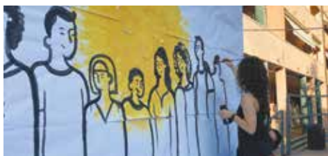
Nel 2020 ha vinto Domeniche in piazza, progetto di animazione di Piazza Amendola