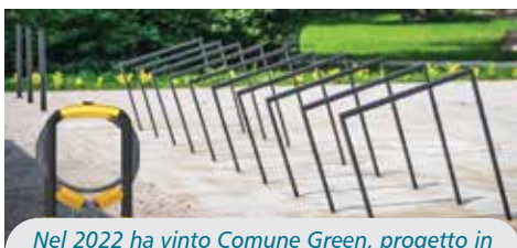
Nel 2022 ha vinto Comune Green, progetto in corso di realizzazione di installazione di rastrelliere e diffusione di super-lucchetti antifurto