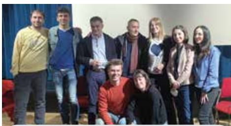
Nel 2021 ha vinto Domeniche al cinema, progetto di socializzazione dei giovani