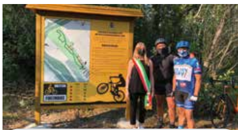
Nel 2019 ha vinto Fortinbike, percorso mountain bike nel bosco planiziale di Trebbo di Reno

Il Bilancio partecipativo mette in palio un budget di 10.000 euro da destinare a progetti presentati da cittadini singoli e associati, sui quali si esprime il voto popolare. ■