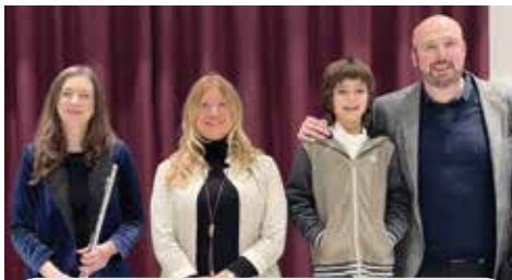
Il Premio Alberghini ha chiuso la giornata con l'omaggio a Maria Callas

e studentesse del Keynes, che hanno trovato riscontro alle proprie osservazioni nella stesura del progetto esecutivo. Nelle assemblee pubbliche di quel percorso partecipato abbiamo anche spiegato il reale impatto del progetto sotto il profilo del consumo di suolo superando le perplessità di molti residenti e utenti del parco. La determinazione e la volontà profuse in questa idea, che è diventata progetto e che ora è realtà, ci rendono orgogliosi e ci permettono oggi di lasciare una importante eredità al futuro di Castel Maggiore, peraltro senza alcun indebitamento perché l'opera è stata autofinanziata". "Oggi vediamo un bellissimo progetto di partecipazione che diventa realtà - ha detto il Presidente della Regione Stefano Bonaccini - a disposizione dei più piccoli e degli adulti, al servizio della comunità, nato da un concorso di idee di giovani e lettori, che potrà diventare punto di riferimento e di accesso alla cultura e alla conoscenza per le cittadine e i cittadini di Castel Maggiore, a partire dai tanti ragazzi che frequentano le scuole vicine. Abbiamo bisogno di avere luoghi fisici capaci di favorire il dialogo tra generazioni e il desiderio di socialità, ed è importante che il parco del sapere e due sale siano intitolati alla scrittrice Natalia Ginzburg e alle giornaliste Anna Politkovskaja e Maria Grazia Cutuli, per ricordarci che il giornalismo, il