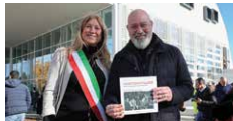
La Sindaca Gottardi dona il libro Arlecchino Danze al Presidente Bonaccini

munale delle ragazze e dei ragazzi e la Consulta Giovani, i fruitori della biblioteca, le bibliotecarie, con incontri durante i quali i progettisti hanno raccolto impressioni, opinioni e valutato proposte di modifica e perfezionamento dell'idea di progetto presentata in fase di concorso. Ora è finalmente possibile dare risposta a quelle funzioni che una biblioteca deve svolgere oggi, non solo un luogo dove si collocano i libri per immetterli nel prestito, ma un luogo di ritrovo, di studio, di consultazione, di socialità, destinato innanzitutto agli studenti e ai ragazzi, ma non solo. Vicinissimo alle scuole secondarie di primo e secondo grado di Castel Maggiore, il Parco del Sapere Ginzburg è destinato ad essere il punto di riferimento per l'accesso al sapere e alla conoscenza della popolazione studentesca, per i docenti, ma anche semplicemente un luogo terzo tra casa e lavoro.