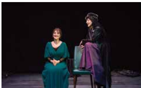
Per Magia

E se per magia mescolassimo le carte, le vite? E se ci scambiassimo i ricordi? Siamo nate nella stessa terra? Fummo sorelle un tempo? E se il tempo scorresse avanti e indietro? Dobbiamo definirci? Siamo donne? Non si potrebbe per magia essere e basta? Cosa di- rebbero di noi le nostre ave? Mescoliamo per magia anche la geografia. E se fossimo nate in Afghanistan o in Iran? Come per magia ribaltiamo in favola la catastrofe e la follia.