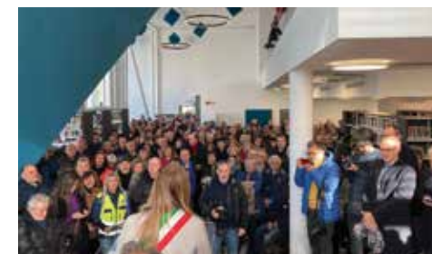
Grande folla accorsa per l'inaugurazione