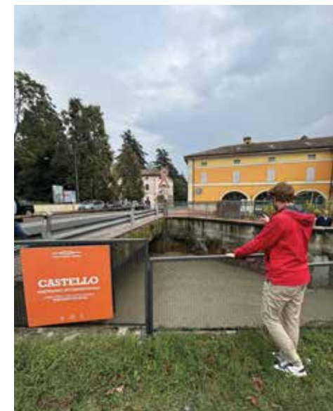
18/9 - Preoccupazione per il Navile