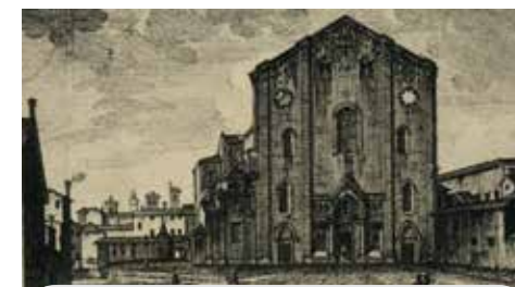
Presso i Prati di S. Francesco (oggi Piazza San Francesco) venivano fucilati i briganti nel 1809-1810