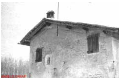
La furnasaza, (fornace)

Era una generosa dispensatrice di fresche acque curative; d'estate i contadini che lavoravano le terre circostanti usavano dare un soldo ai ragazzini per farsene portare un fiasco, per cui i ragazzini facevano gare di velocità per arrivare con acqua fresca. E siccome da cosa nasce cosa, un accorto agricoltore, "AL DRAGON", un ferrarese o veneto, ex militare dei dragoni di Sardegna, seppe sfruttare l'amenità del posto e l'afflusso delle persone, specialmente giovani che facevano le serali passeggiate romantiche e poetiche sotto i gelsi in filari e le acacie del boschetto circostante la fontanina. Al Dragon, che con