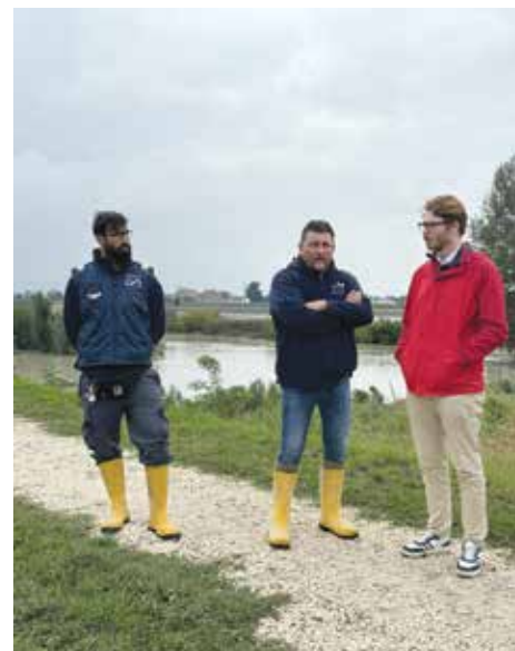
18/9 - Il Reno a Trebbo