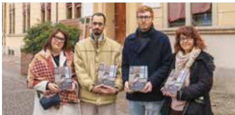
Il Giorno della Memoria

Sabato 25 gennaio lo spettacolo della stagione Agorà "In quelle tenebre", incentrato sulla figura del comandante del campo di concentramento di Treblinka, ha suscitato forte emozione in un teatro Biagi D'Antona strapieno, di studenti del Keynes alla mattina e di spettatori di ogni età alla sera. Anche il Centro di lettura L'Isola del Tesoro ha par-