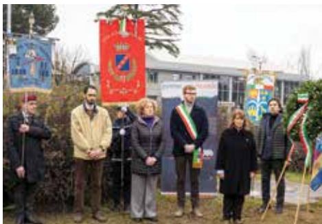
Il Giorno del ricordo

Il 9 febbraio anche a Castel Maggiore, presso la rotatoria intitolata ai Martiri delle foibe, una piccola folla di esponenti dell'Associazione Nazionale Venezia Giulia e Dalmazia, autorità civili e militari, associazioni d'arma e semplici cittadini, ha rinnovato il ricordo della tragedia delle vittime delle foibe, dell'esodo dalle loro terre degli istriani, fiumani e dalmati nel secondo dopoguerra. Un doveroso atto di memoria verso le popolazioni italiane del confine orientale, vittime degli eventi, perseguitate e costrette ad abbandonare