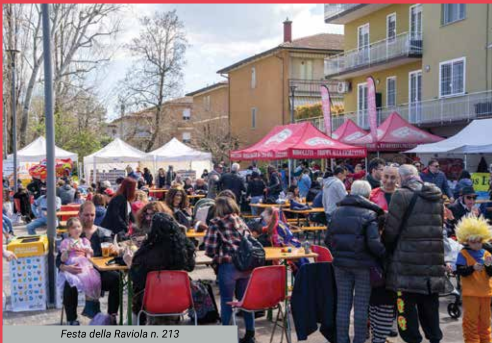
Festa della Raviola n. 213

Segnaliamo anche, al di fuori della tematica resistenziale, Album di Kepler-452 (sabato 10 maggio ore 19 e ore 21, Centro Sociale Pertini, via Lirone 30), una macchina del tempo, un album scenico di fotografie senza confini nato raccogliendo storie e immagini da varie parti d'Italia e d'Europa, che si misura con la memoria e con il suo sbiadire. Tutto il cartellone sul sito stagioneagora.it