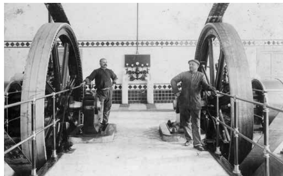
Un'immagine d'epoca di un interno dell'Officina Gaetano Barbieri, fondata nel 1867 come fonderia di ghisa, progenitrice dell'attuale stabilimento Clauger Technofrigio