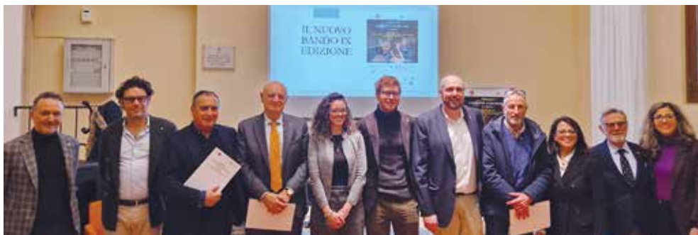
I protagonisti della 9ª edizione alla presentazione alla stampa

Dopo lo straordinario successo registrato nella precedente edizione, con un record di oltre trecento partecipanti, il Premio Giuseppe Alberghini, concorso istituito nel 2015 dall'Unione Reno Galliera con lo scopo di sostenere e valorizzare la cultura musicale classica tra i giovani e favorire l'affermazione di artisti emergenti, lancia la sua nona edizione.