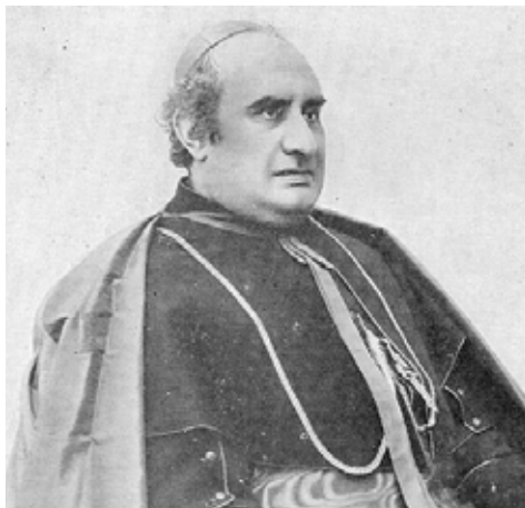
Il cardinale Domenico Svampa, Arcivescovo metropolitano di Bologna dal 1894 al 1907