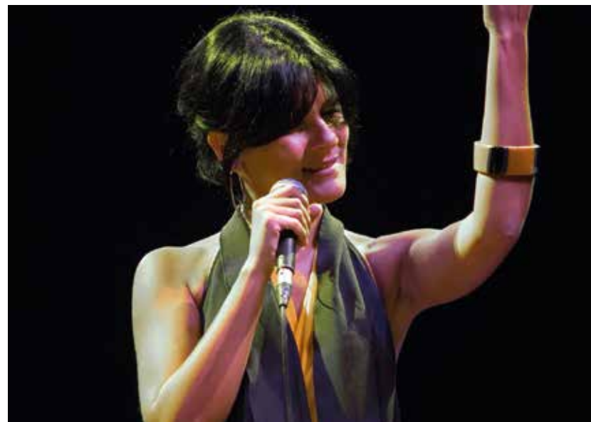
Flò in concerto il 28 giugno

Per informazioni: juniorpoetryfestival@gmail.com ■